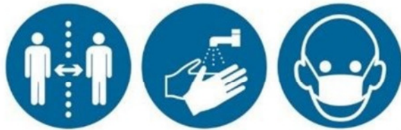
Abstand Hygiene Alltagsmaske